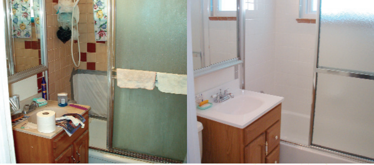
Before / Antes