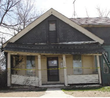
Before / Antes