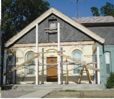
During / Durante